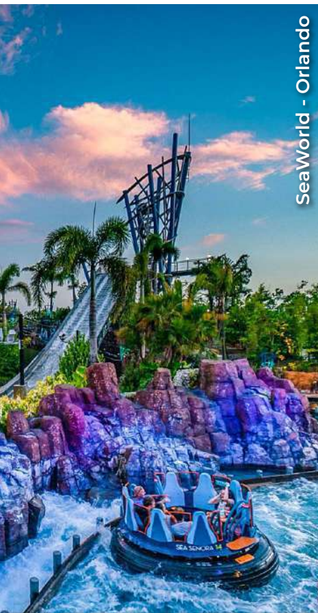
SeaWorld - Orlando