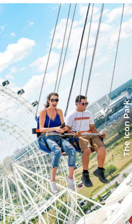
The Icon Park