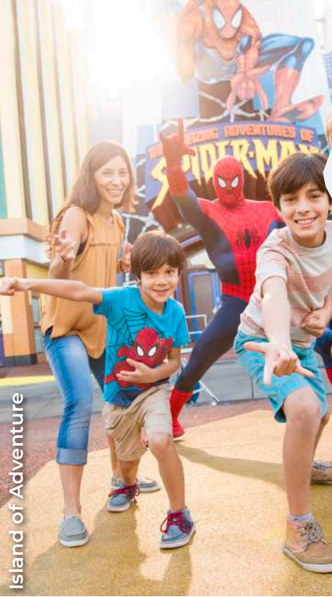
Island of Adventure