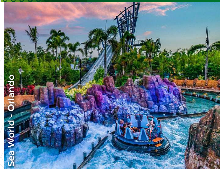
Sea World - Orlando